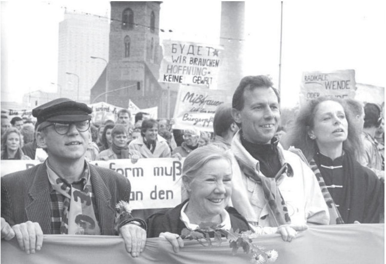
Berlin, Oktober 1989